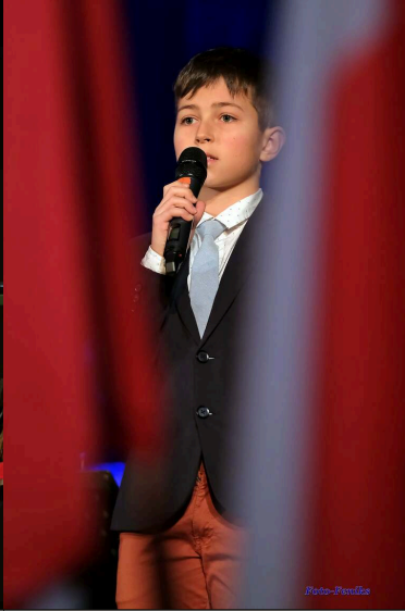
Narodowy Dzień Pamięci o Żołnierzach Wyklętych