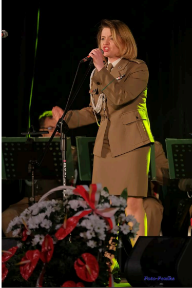
Narodowy Dzień Pamięci o Żołnierzach Wyklętych